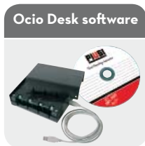
Ocio Desk software